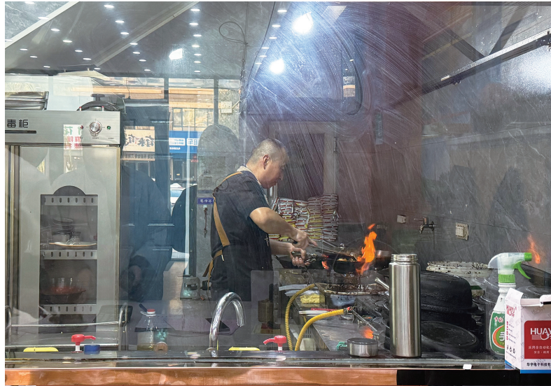
●明厨亮灶,保障市民舌尖安全