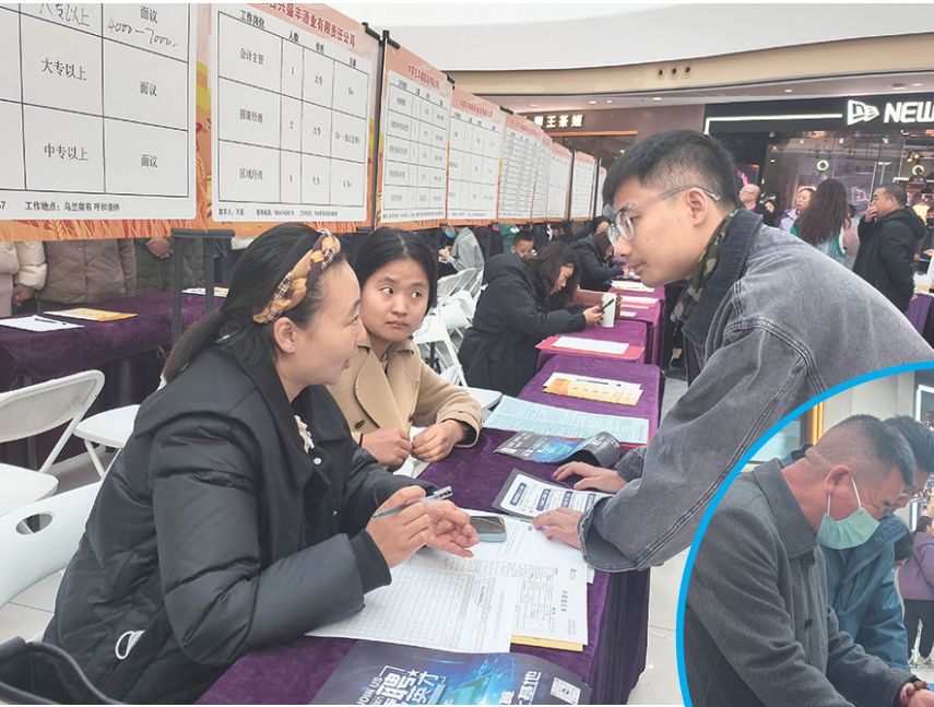
●企业招聘负责人介绍工作性质

本报讯(记者 刘佳鑫)11月15日,集宁区2025年就业促进行动系列活动秋冬专场招聘会在集宁万达广场启