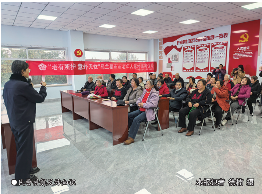
●民警讲解反诈知识

“最近反诈民警来到社区,开展普法活动。内容贴近生活,讲解通俗易懂,让我们和居民都学到了很多实用的法律知识,增强了用法律武器保护自身