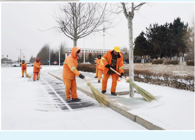
▼环卫工人清扫辅道积雪。

12月1日下午，集宁区迎来降雪，路面积雪给市民出行带来不便。乌兰察布世基环境科技有限公司迅速启动清雪应急预案，第一时间组织开展清雪作业。