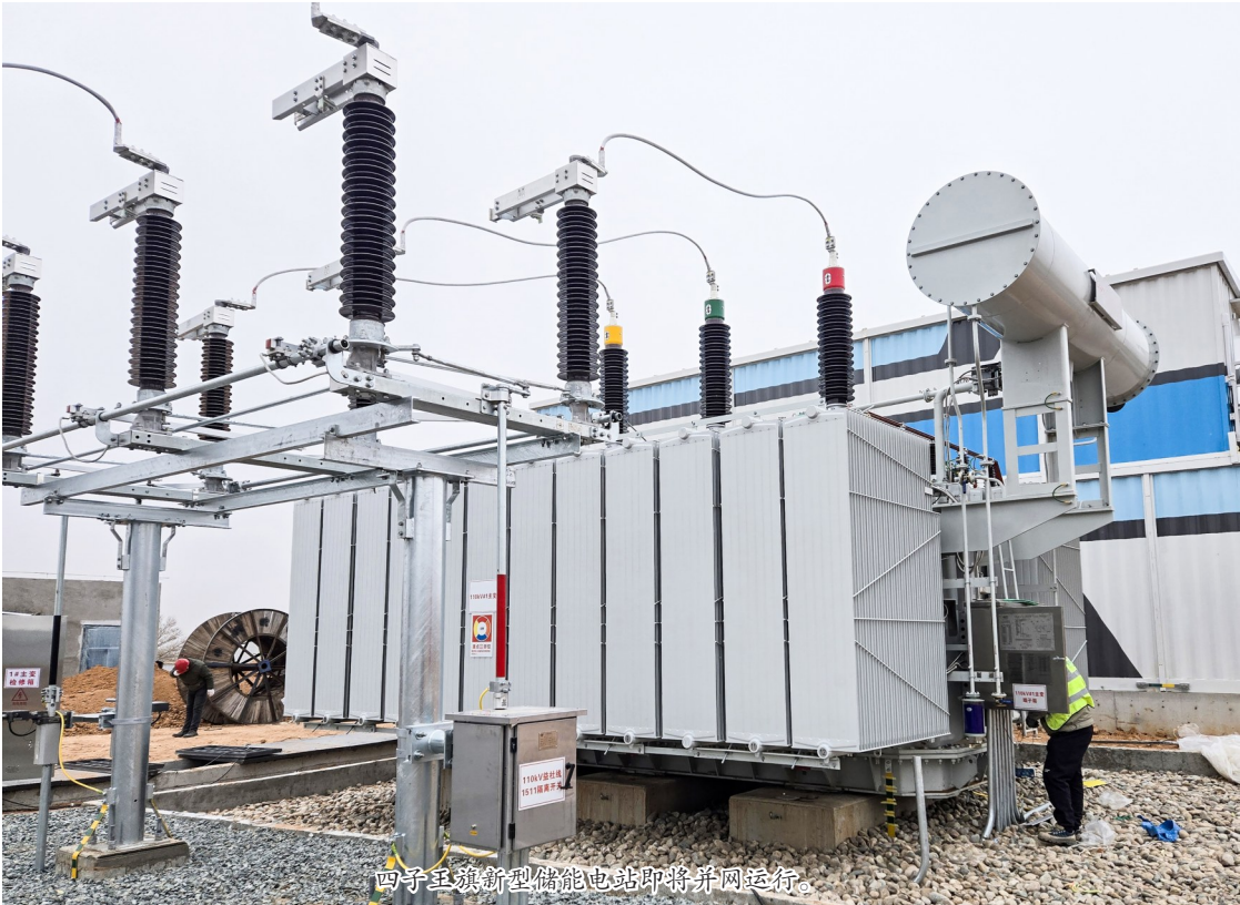
四子王旗新型储能电站即将并网运行。