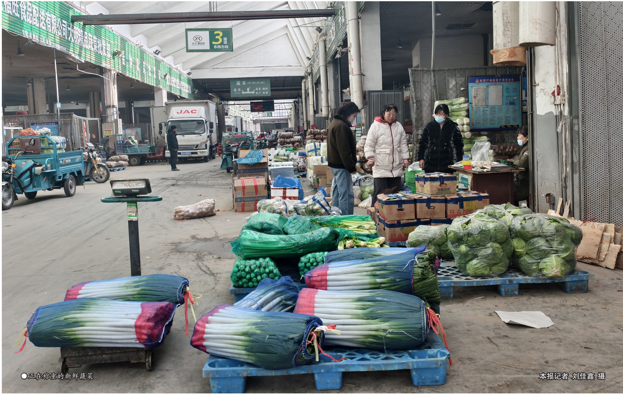
●正在称重的新鲜蔬菜