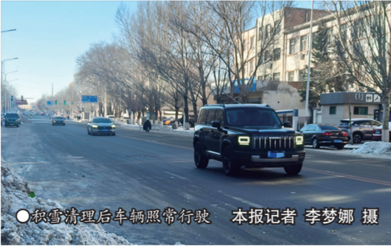
● 极雪清理后车辆照常行驶

赵志勇还提醒,雪天出行安全第一,车主们应根据实际路况合理选择雪地胎或防滑链,避免因使用不当引发安全隐患,同时做好轮胎的日常养护,确保出行平安。