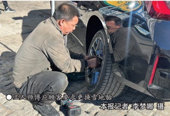
● 工人师傅应顾客要求更换雪地胎